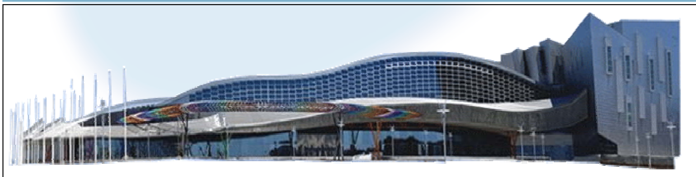
Palacio de Ferias y Congresos de Málaga